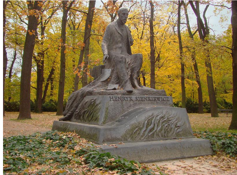
Pomnik Henryka Sienkiewicza w Warszawie

Pomniki Henryka Sienkiewicza znajdują się w Vevey (Szwajcaria), Warszawie, Bydgoszczy, Słupsku, Szczawnicy, Gdyni, Kielcach, a także w Okrzei oraz wielu innych miastach.